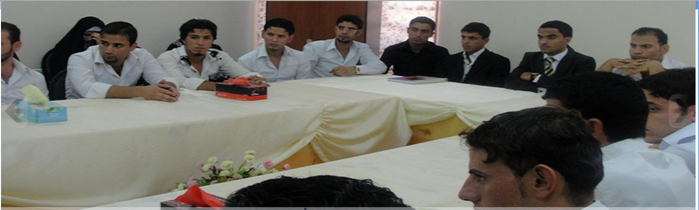
منظمة تموز تنظم ورشة عمل لشباب الجامعات لإبداء آرائهم حول شكل الدولة المدنية الحديثة