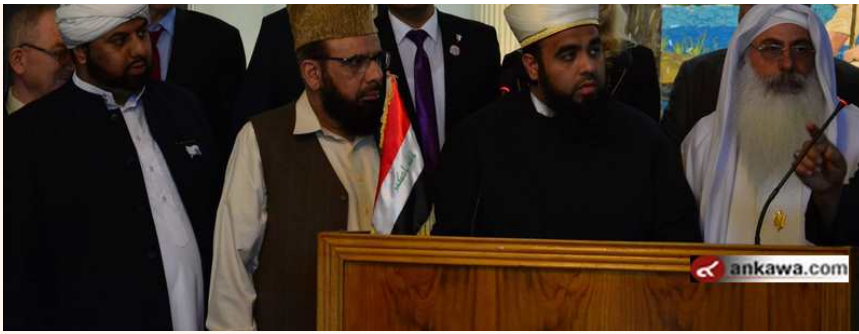
(42.17.3 jpg كيلو بايت, 800x533 - زيارته 229 مرات.)