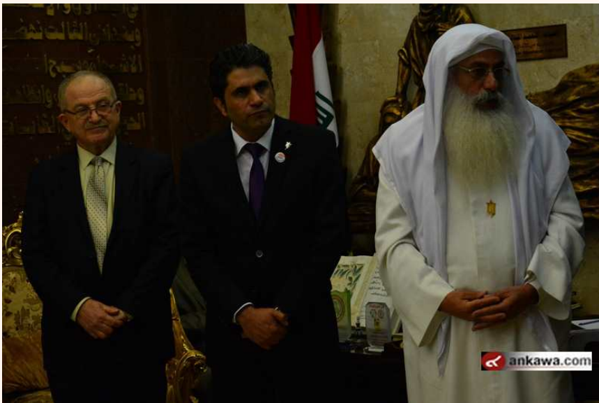
(33.3.5 jpg كيلو بايت, 800x533 - زيارته 243 مرات.)