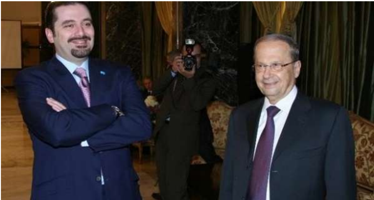
الليونة «الحريرية» تجاه عون هكذا بدأت... وهنا توقفت! (http://www.newlebanon.info/lebanon-now/276835) الليونة «الحريرية» تجاه عون هكذا بدأت... وهنا توقفت! (http://www.newlebanon.info/lebanon-now/276835) الليونة «الحريرية» تجاه عون هكذا بدأت-وهنا توقفت