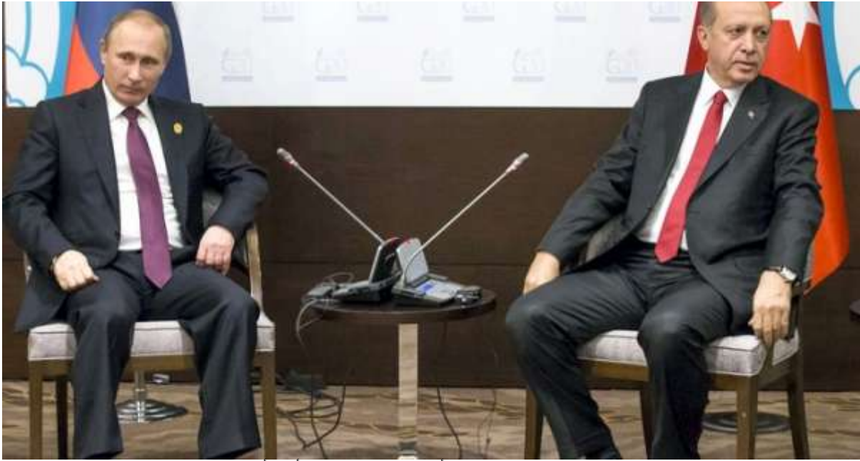
أردوغان يجد في روسيا أجواء أكثر راحة من منغصات الغرب (http://www.newlebanon.info/lebanon-now/276837) أردوغان يجد في روسيا أجواء أكثر راحة من منغصات الغرب (http://www.newlebanon.info/lebanon-now/276837) أجواء أكثر راحة من منغصات الغرب