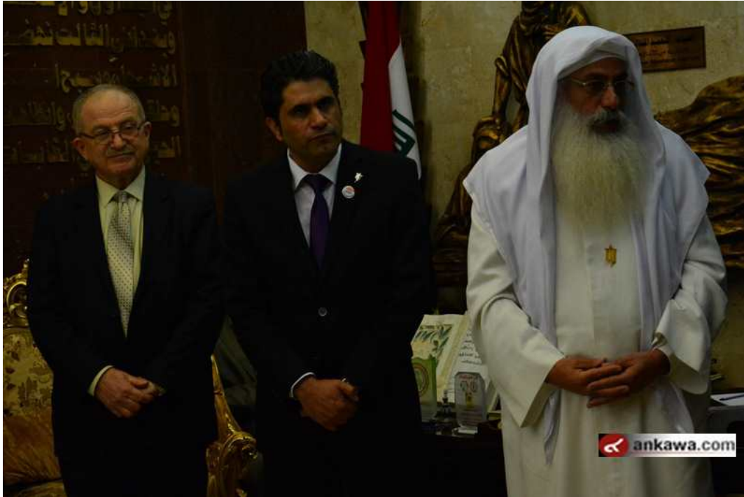
(33.3.5 jpg كيلو بايت, 800x533 - زيارته 222 مرات.)