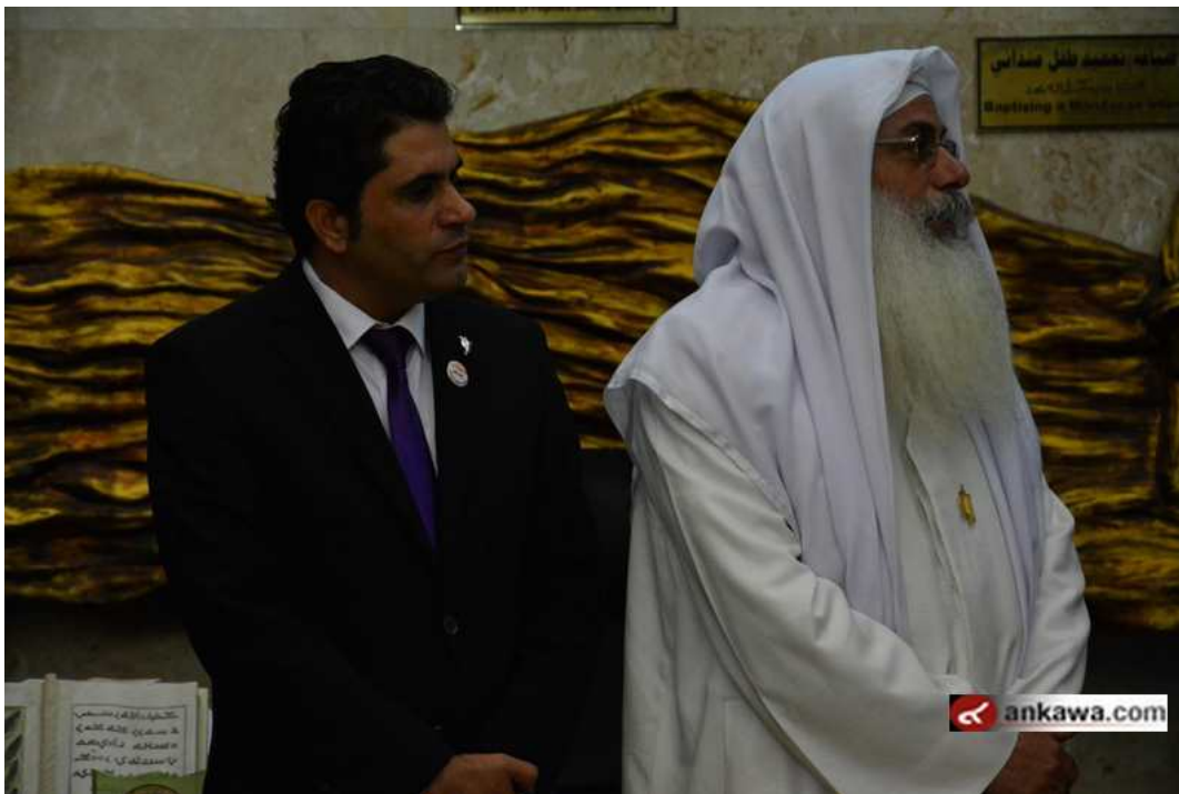
(34.48.6 jpg كيلو بايت, 800x533 - زيارته 198 مرات.)