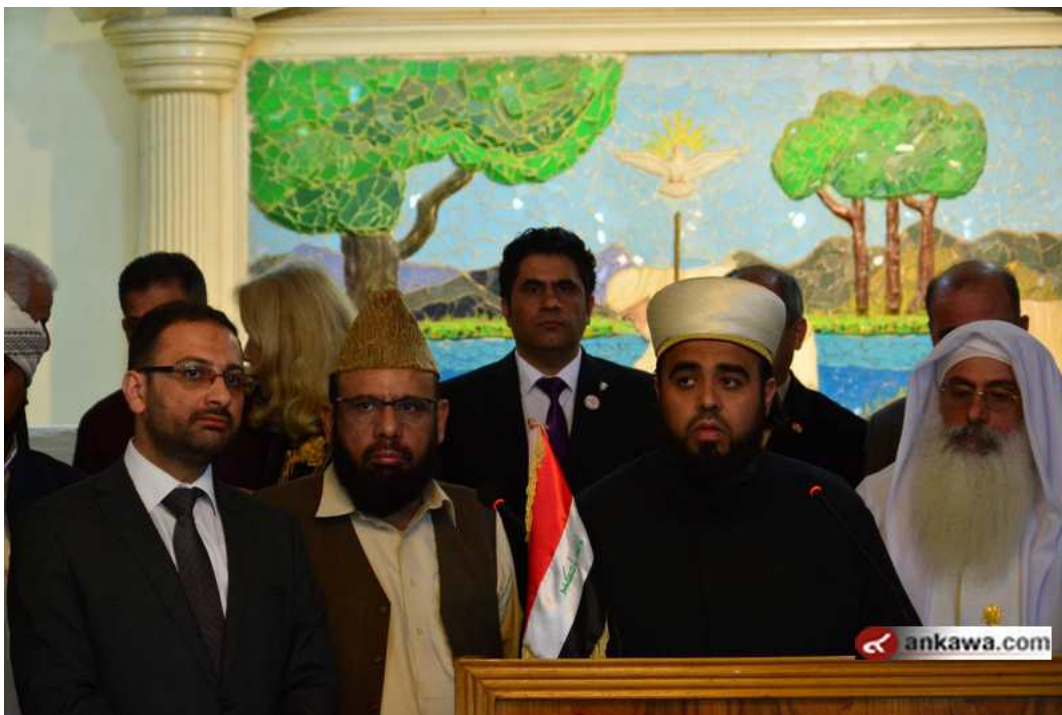
(43.09.7 jpg كيلو بايت, 800x533 - زيارته 198 مرات.)