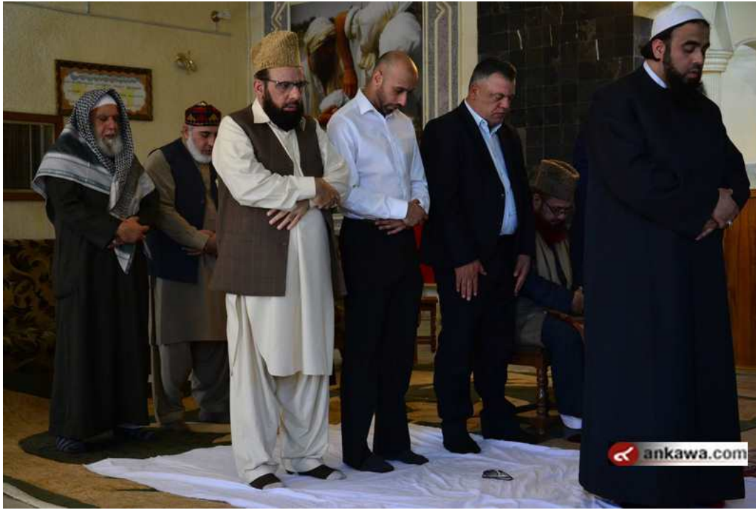
(39.29.2 jpg كيلو بايت, 800x533 - زيارته 224 مرات.)