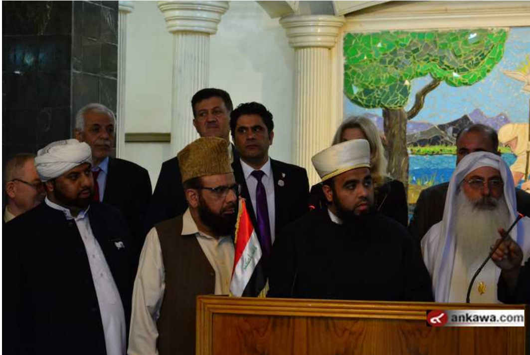
(42.17.3 jpg كيلو بايت, 800x533 - زيارته 222 مرات.)