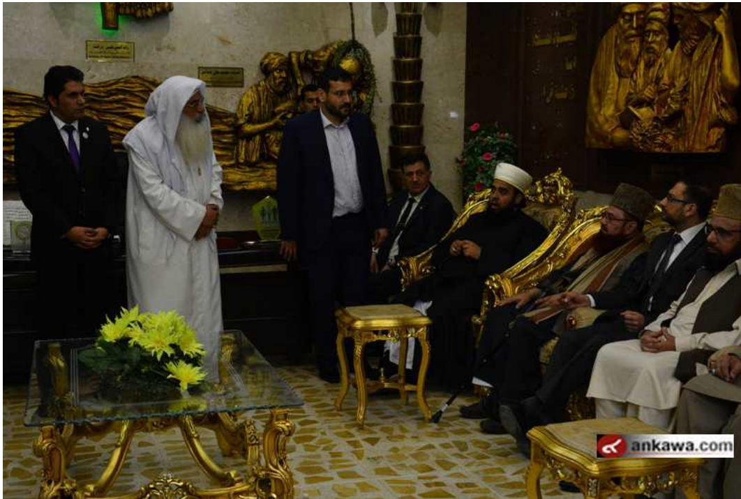
52.24.1 jpg (52 كيلو بليت، 800x533 - زيارته 223 مرات)