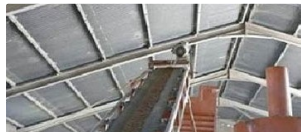
تجهيز المطاحن بخلاطات الحنطة لإنتاج طحين الحصة التمثونية