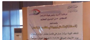
«الصحافة الاستقصائية ودورها في كشف مواطن الفساد»