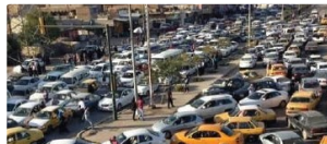
أمانة بغداد تناقش المخططات المعدلة لمعالجة الاختناقات المرورية